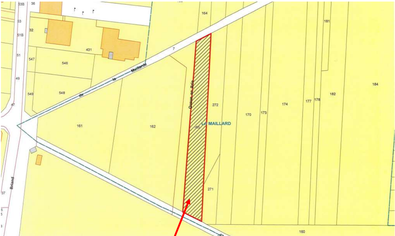
Parcelle AR 165